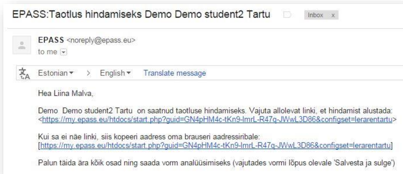
Joonis 2. Kirja sisu